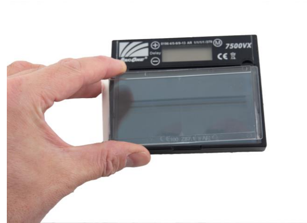
5.3 Montera korrektionsglaset på insidan av svetsglaset.