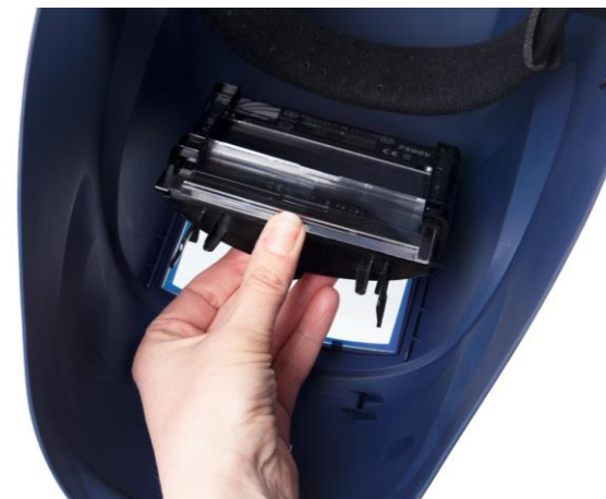
5.4 Skjut in svetsglaset i hållaren. Klicka tillbaka hållaren och skruva tillbaka skruven.