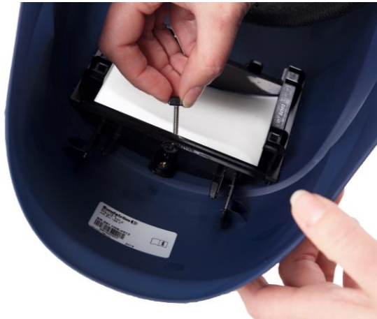
5.1 Lossa skruven i hållaren som håller svetsglaset