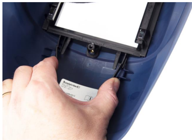
5.2 Lossa hållaren som håller svetsglaset.