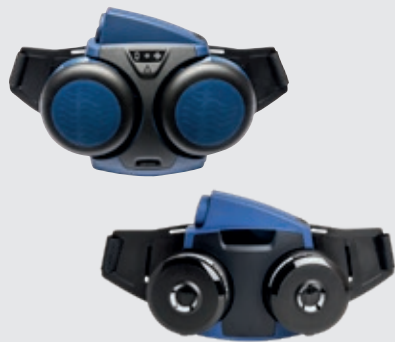
Fläktenhet SR 500 eller SR 700 med partikelfilter SR 510 P3 R

Tung arbetsbelastning och höga dammkoncentrationer. För slätrakade användare men även för de med ansiktsbehåring som skägg eller polisonger.