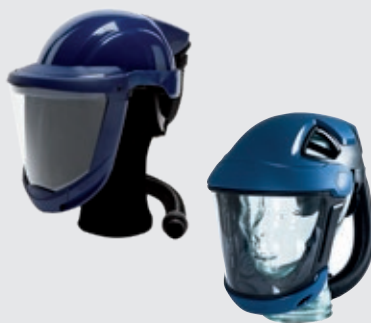
Skärm SR 570 med eller utan bump cap för skydd mot stötar beroende på arbetet eller SR 580 Hjälms med visir.